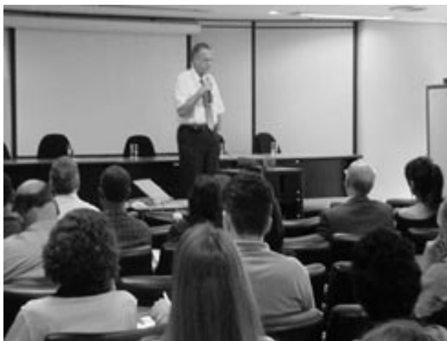
Programa de Capacitação do Denatran. Turma de Belo Horizonte

O CTBT foi iniciado em 26 de abril do corrente ano. Até outubro de 2004 foram realizados 19 cursos com um total de 911 participantes. A primeira fase do CTBT encerra-se em 03