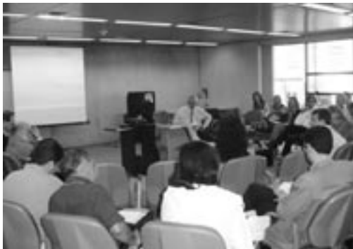
1º Seminário Nacional de Experiências de Capacitação e Desenvolvimento Institucional. Goiânia/GO, agosto de 2004

Entre as prioridades do Ministério para 2005 e 2006 destacam-se i) a capacitação de técnicos do setor público e agentes sociais para a elaboração de planos diretores participativos, e ii) o apoio e capacitação dos municípios para a implementação e gestão de cadastros territoriais. Além dessas duas prioridades gerais, outras são definidas segundo os setores do Ministério, consideradas as especificidades das diferentes áreas de atuação.